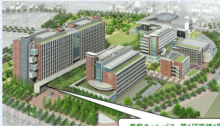
葛飾キャンパス 第1研究棟1階東側