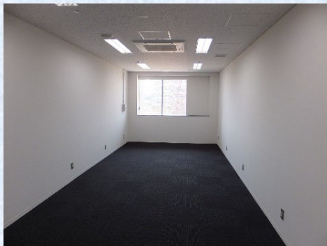
インキュベーションルーム