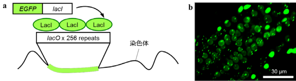
図1: 本研究で使用した染色体の可視化システムについて a. クロマチン蛍光タグシステム、 lacO/LacI-EGFP システムの概略図。このシステムが導入された生物では、染色体の一部に蛍光タンパク質が局在するようになるため、その染色体領域が可視化される b. lacO/LacI-EGFP システムが導入されたシロイヌナズナの根。一つの細胞核からは、相同な染色体座に由来する2つのドット状のシグナルが検出される