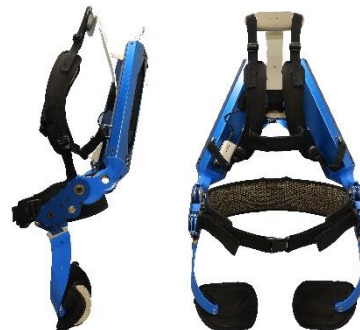
装着型の「腰部補助用マッスルスーツ®/標準モデル」