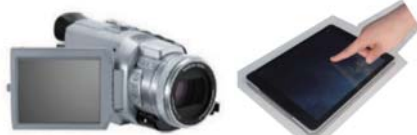
動画取り込み&リアルタイム処理

実用性評価に取り組んでいただける共同研究企業、地方自治体、維持管理主体を募集しています。