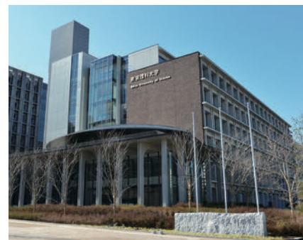
東京理科大学 葛飾キャンパス (葛飾区新宿6-3-1)