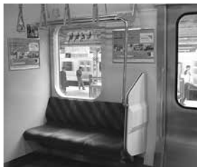
우선석 Priority seats