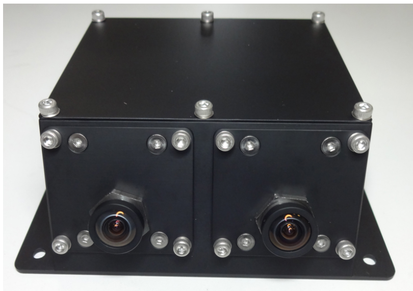
図2：デブリセンサ監視用カメラ