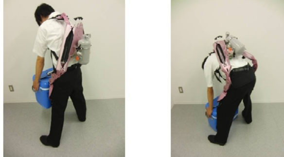
装着型の「腰部補助用マッスルスーツ®」

マッスルスーツ®は、着用により人間の動きをサポートする動作補助ウェアで、背筋力を補うことで負担を軽減し、介護現場や物流・工場・工事等種々の重量物移送作業における動作場面において活躍が期待されます。