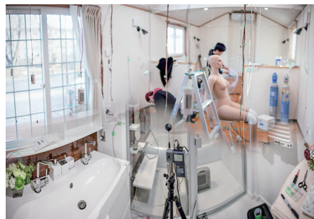
室内にさまざまな装置を設置して実験・実測する