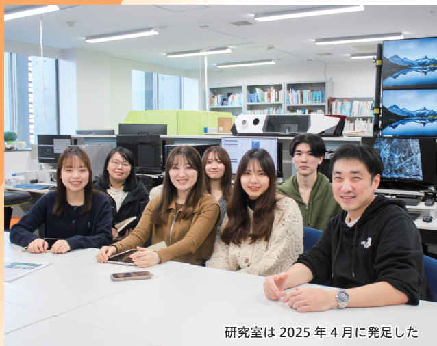
研究室は 2025 年 4 月に発足した