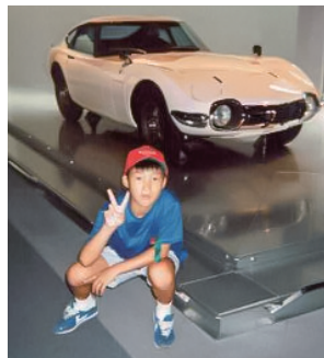
小学校低学年のとき、トヨタ博物館での写真。父親と一緒に。

「『DX、できてますか?』と聞かれても、『そんなの当たり前ですよ』と答えられる世界にしたい。時間がかかることだけど、アプローチ次第で10年の道のりを5年に縮められる。そこに挑戦しています」