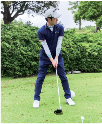
◀大学ではゴルフ部に所属。熱心に練習に参加し、「人並み以上」の腕前に。 ▼東京理科大学の卒業式の日。隣の女性と後に結婚。