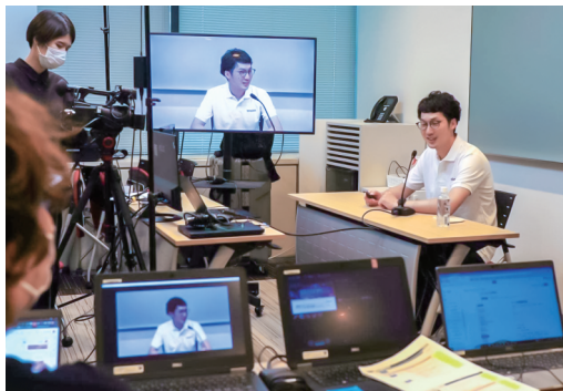
2020年頃から講演依頼が増え、今は年に20回を超える依頼がある。写真は2022年の収録シーン。