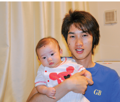
25歳のときに生まれた長女と。この子今は高校生。