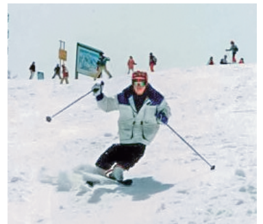
小学校高学年のころ。幼少時から毎シーズン必ずスキーに行っていた。