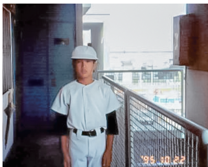
小学校の頃から中学まで野球に熱中していた。