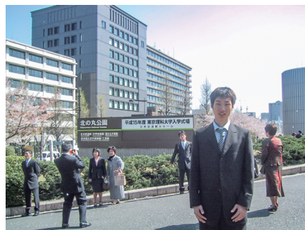
東京理科大学に入学。東京での一人暮らしが始まった。