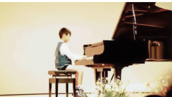
幼少期から習い始めたピアノ。今は自分の子どもと連弾することも。

ちなみに、このAIの実装にかかった費用は、工場のラインをモニタリングするためのカメラと小さなコ