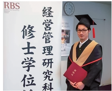
睡眠時間 3 時間の猛勉強はきつかったが無事 MBA を取得。