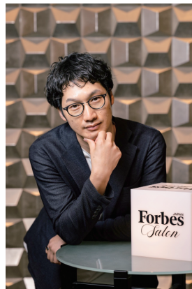
「Forbes JAPAN CIO Award 2024-2025」において、「次世代のテクノロジーリーダー」としてチェンジレガシー賞を受賞。