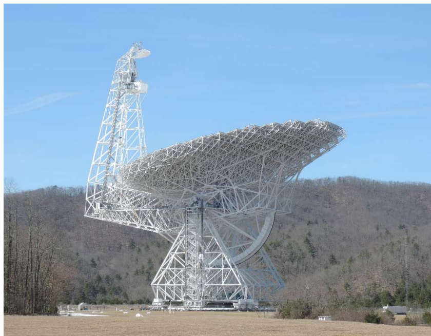
図2 アメリカ国立電波天文台のグリーンバンク 100 m 電波望遠鏡 アンテナ可動式で単一鏡の電波望遠鏡としては世界最大。(滞在時に撮影)

2015年に2シーズン1年間にわたり、延べ43時間の観測を行いました。初め3月に現地に赴き観測を行い、その後東京理科大学から現地の望遠鏡を操作する“リモート観測”を行いました。