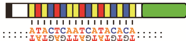
図1 TALE-FP の分子構造